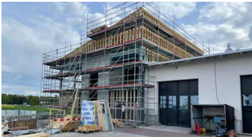
Under arbete. Så här såg Byrsta brandstation ut tidigare i våras. Men arbetet går bra och det händer mycket på kort tid.